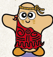
三内丸山遗址吉祥物“三丸”