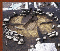
(右) ⑫大型半地下式建筑(复原)