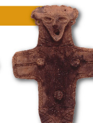
大型板状土偶 (重点文物)