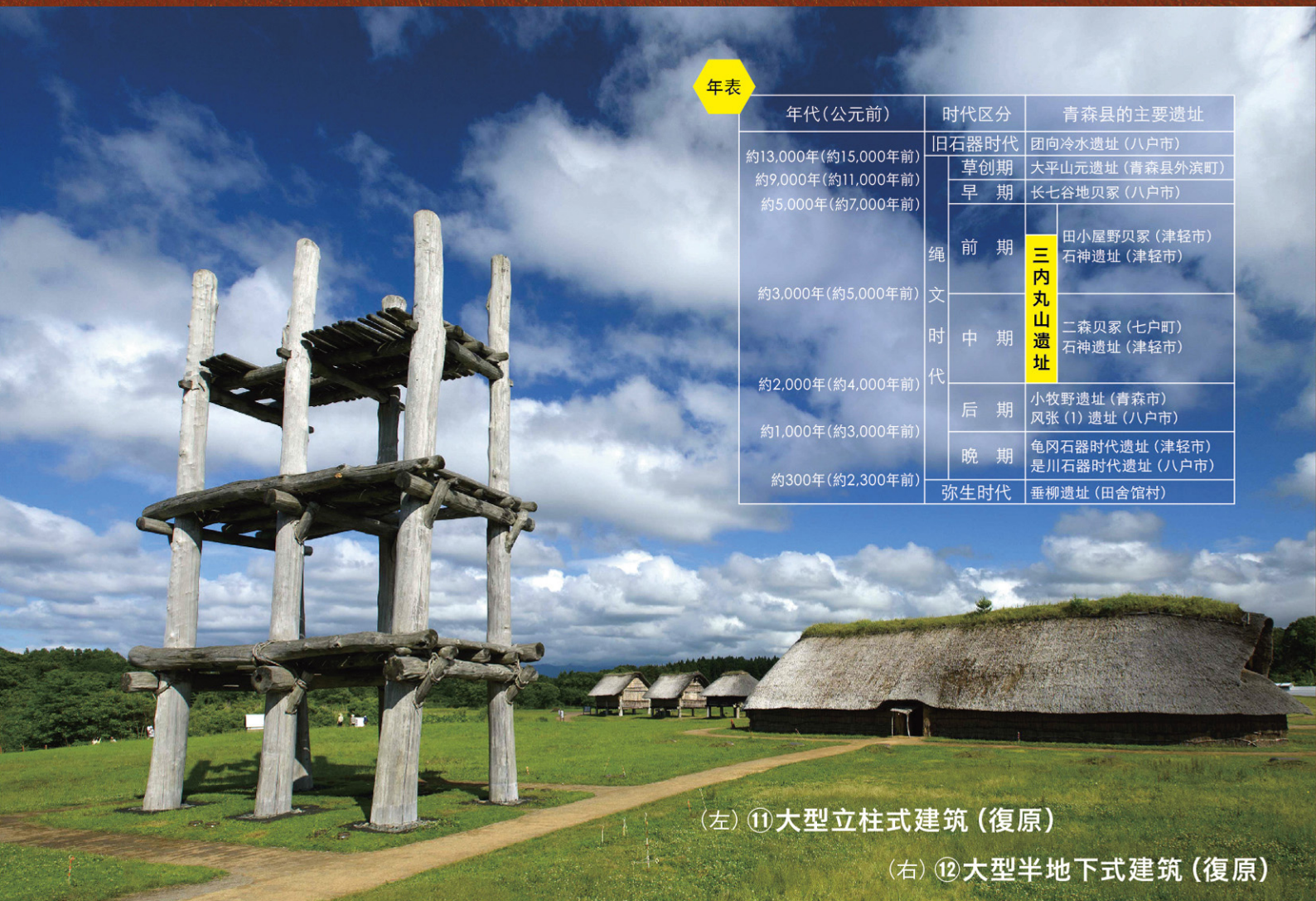
(左) ⑪大型立柱式建筑(复原)