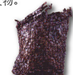
绳文时代编篮 (重点文物)