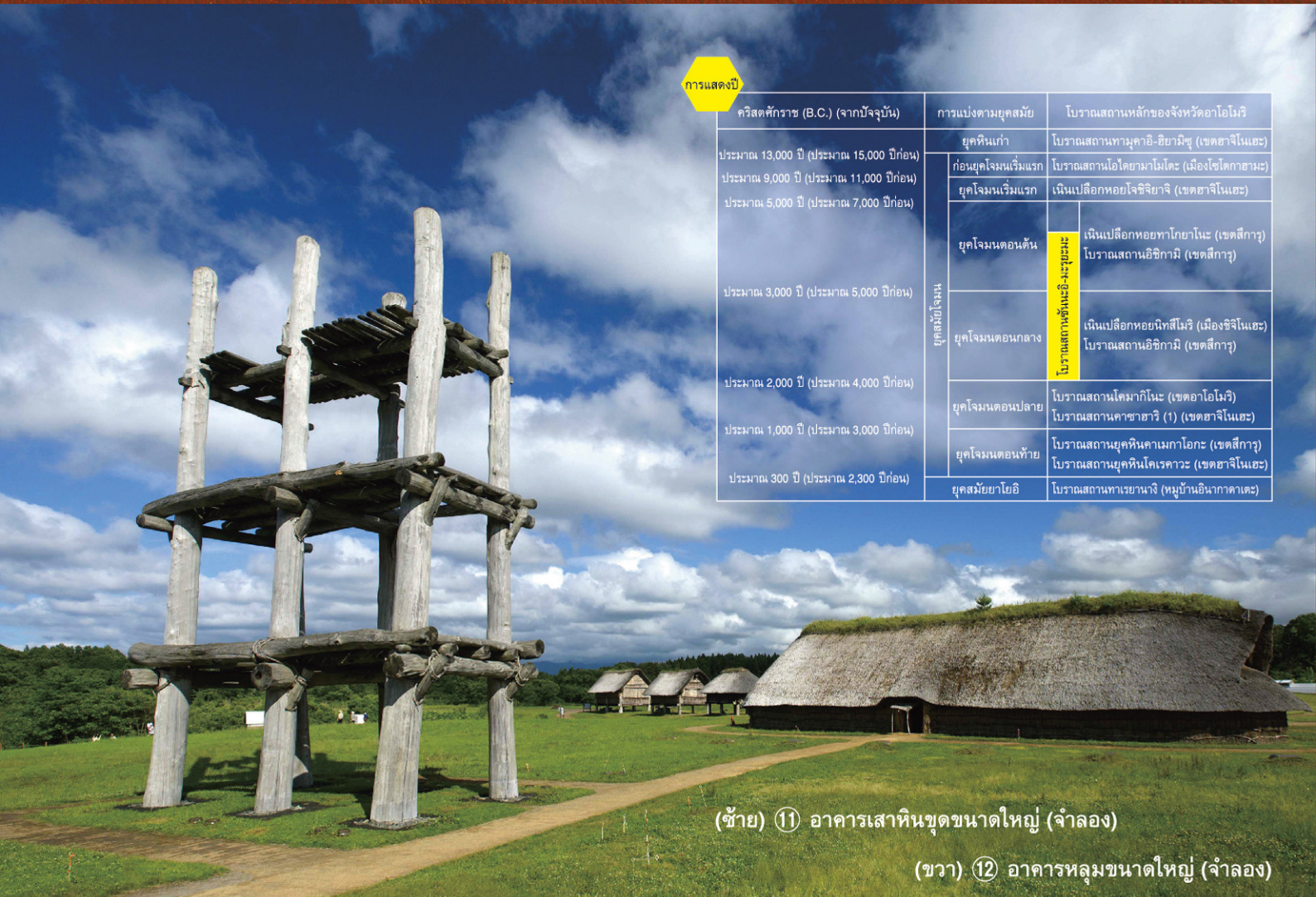
(ซ้าย) 11 อาคารเสาหินชุดขนาดใหญ่ (จำลอง)