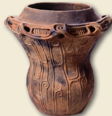
大木式土器 Daigi-style pot