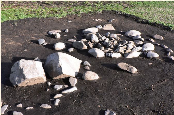
配石遺構 / Remains of stone arrangements