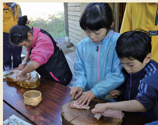
石器、土器で料理体験 Cooking foods with stone tools and earthen pots

御所野縄文博物館では土器づくりやアクセサリーづくり、樹皮編み体験など、様々な縄文体験を受け付けております。