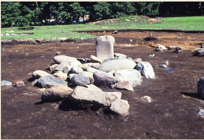
配石遺構 / Remains of stone arrangements