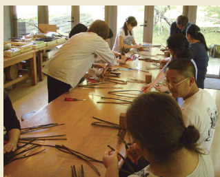
樹皮編み体験 Bark weaving