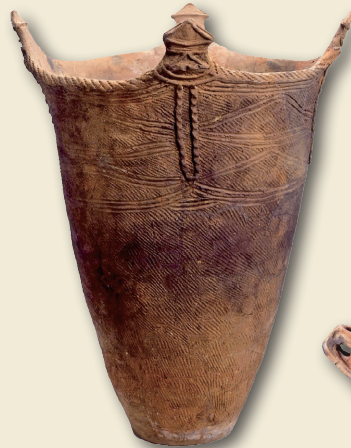
円筒式土器 Cylindrical pot