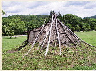
復元樹皮葺き建物 Reconstructed dwelling with the bark roof