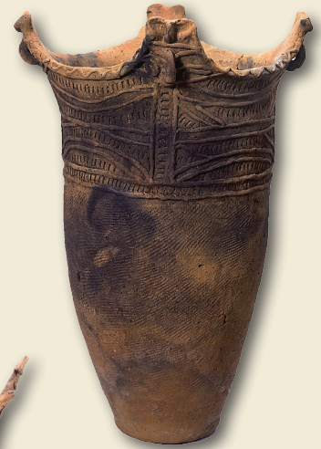
円筒式土器 Cylindrical pot