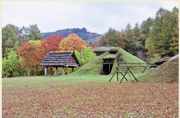
東ムラ / Eastern village