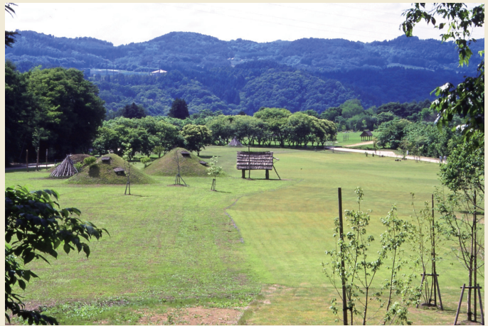
御所野遺跡遠景 (東から) / Distant view of the Goshono Site (from the east)

Ichinohe Town Board of Education Goshono Jomon Museum TEL : +81 195 32 2652