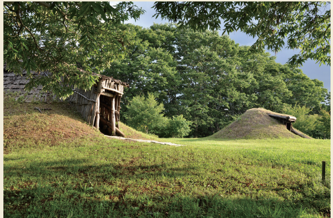
中央ムラ / Central village