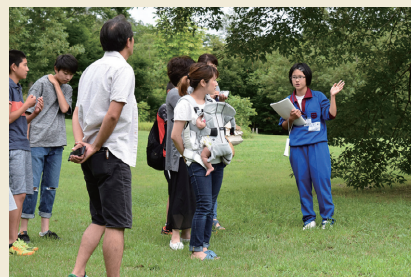
子どもガイド Kid guides

Volunteers, mainly local citizens, help visitors as guides and assist events as supporting staff. People living nearby gather twice a year and join forces to clean the archaeological site. The Goshono Site receives a lot of support from local communities.