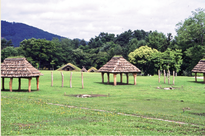
復元された中央部の掘立柱建物 / Reconstructed pillar-supported buildings in the central area of the site