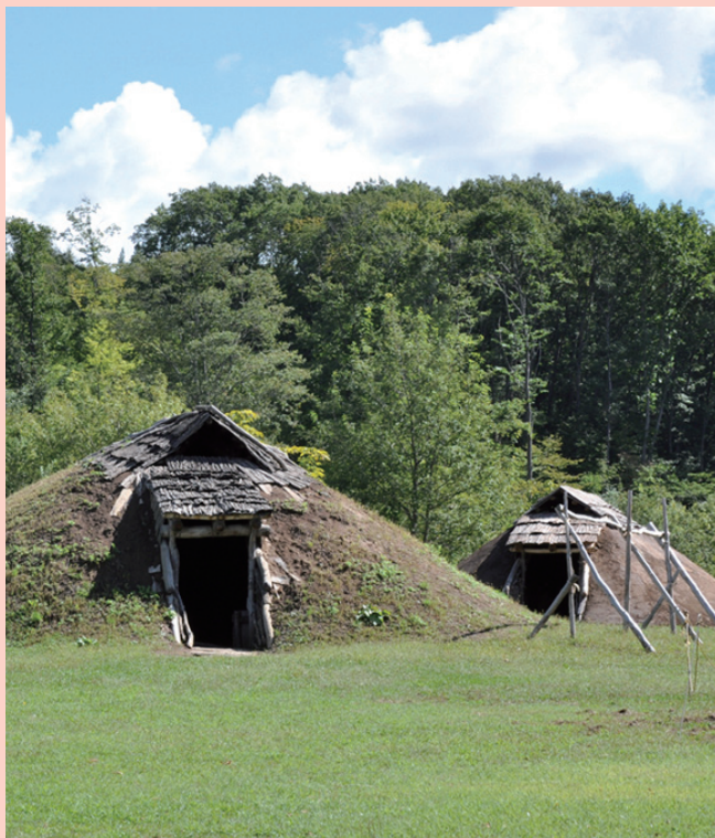
復元竪穴建物 / Reconstructed pit dwellings