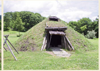
復元土屋根建物 Reconstructed dwelling with the soil roof