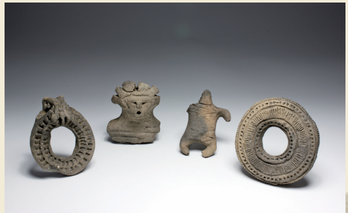
土偶 (中央) と環状土製品 (両端)

(from the Late Jomon period : 4,000-3,700 years ago)