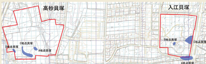
Takasago Burial Site

Several pieces of the Irie-style earthenware were unearthed.