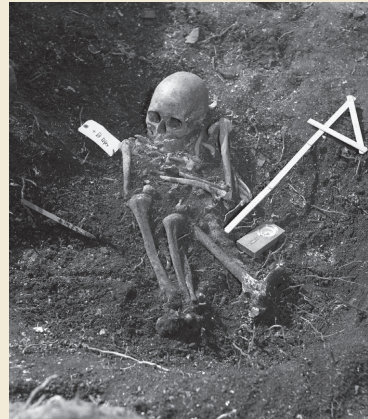
縄文時代晩期の墓 (右)

The human bone infected with poliomyelitis. It reveals that he was cared for at least more than ten years, and such care made it possible for him to live longer, with trouble in the limbs.