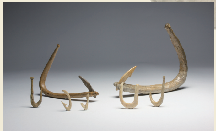
入江貝塚から出土した単式釣針と組合せ式釣針

Harpoon head from the Irie Site and the Takasago Burial Site