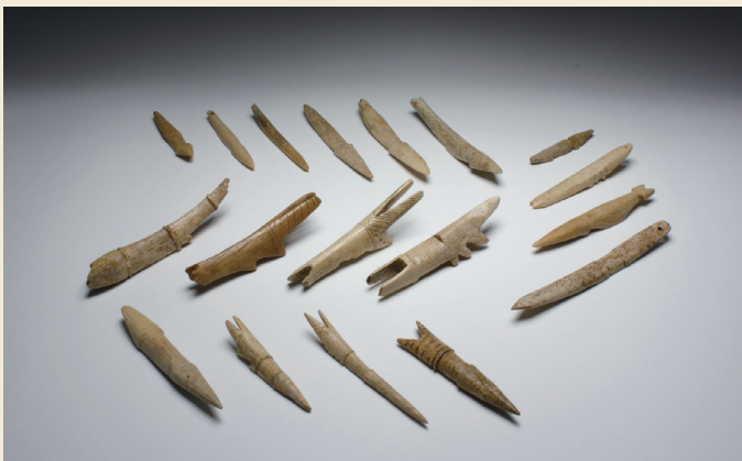
入江・高砂貝塚から出土した銚頭

Harpoon head from the Irie Site and the Takasago Burial Site