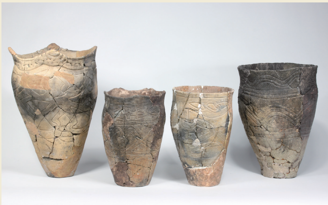
入江式土器 (縄文時代後期: 約4,000~3,700年前)