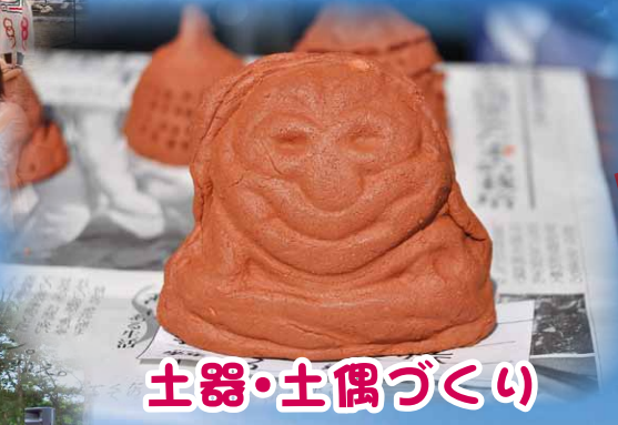
土器・土偶づくり