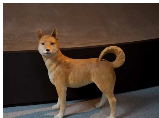
二ツ森貝塚から出土した犬の骨をモデルに復元