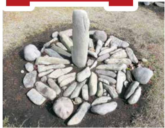
「日時計状組石」大湯環状列石