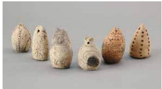
「鐻形土製品」大湯環状列石