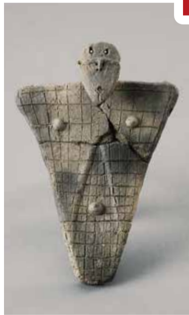
「土偶」伊勢堂岱遺跡