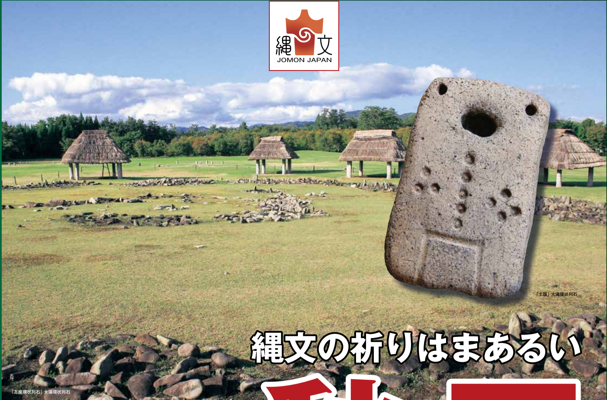
「土版」大湯環状列石