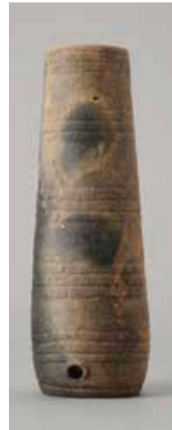
「有孔土器」大湯環状列石