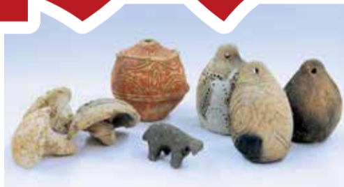
「マツリの道具」伊勢堂岱遺跡