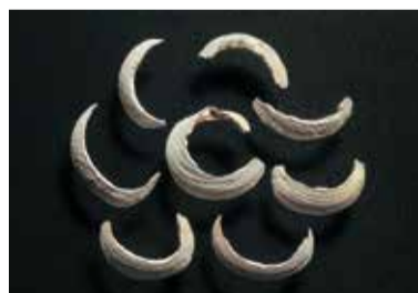
「ベンケイガイ製貝輪」田小屋野貝塚