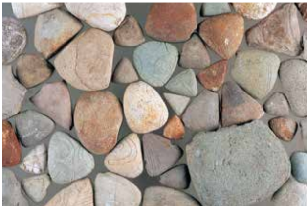
「三角形岩版」小牧野遺跡