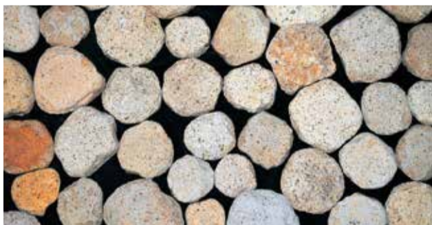
「円盤状石製品」大森勝山遺跡