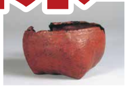
「鉢形藍胎漆器」是川石器時代遺跡