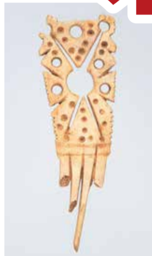
「鹿角製櫛」ニツ森貝塚