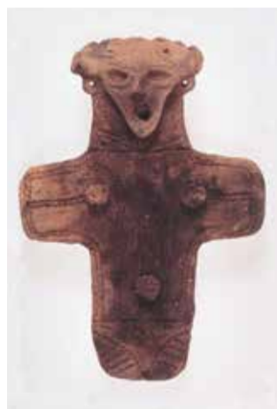
「大型板状土偶」三内丸山遺跡