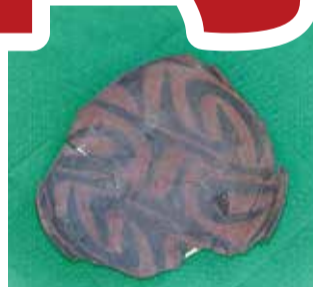
「藍胎漆器」亀ヶ岡石器時代遺跡