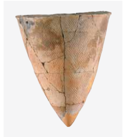
「尖底深鉢土器(赤御堂式)」長七谷地貝塚