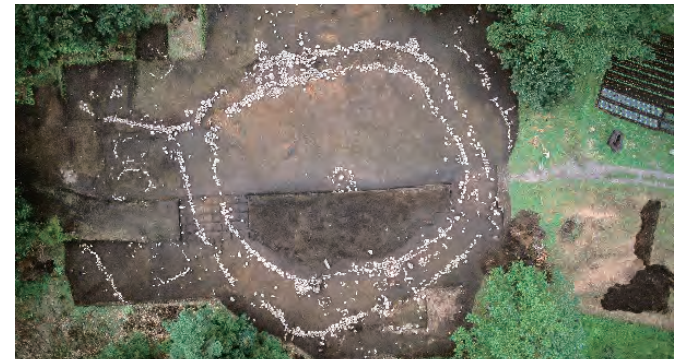
真上から見た環状列石

展示施設 縄文の学び舎・小牧野館、小牧野の森・どんぐりの家 TEL 017-757-8665 http://komakinosite.jp/index.php