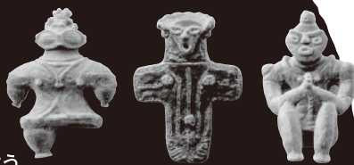
遮光器土偶・板状土偶・合掌土偶の3体セット (掲載している画像はサンプルイメージです)

クイズに答えてオリジナル縄文フィギュアをGETしよう。 ジャンケン大会 ①12:30 ②14:30 ③16:30