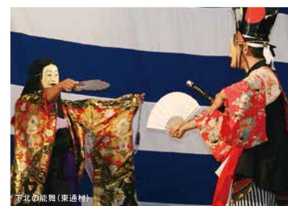
下北の能舞(東通村)