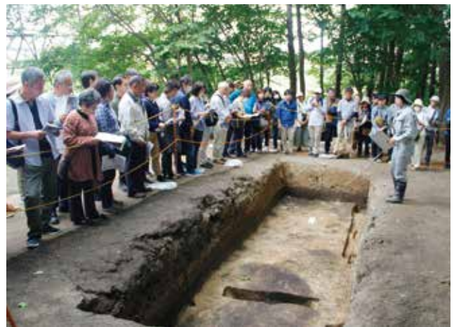
現地説明会(三内丸山遺跡)

また、キウス周堤墓群(千歳市)や亀ヶ岡石器時代遺跡(つがる市)では、これまでの発掘調査や研究成果をまとめた総括報告書が刊行され、遺跡の全体像がより詳しく示された。