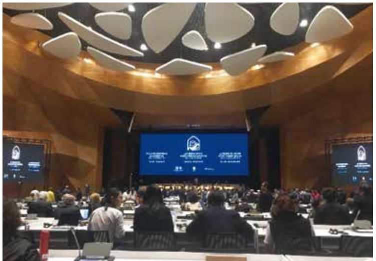
第43回世界遺産委員会会場

我が国の世界遺産の総数は現在、文化遺産19件、自然遺産4件の計23件である。遺産の規模や類型は多様で、構成資産が持つ周辺環境も様々であり、それぞれに適した保存と活用の在り方が求められる。特に近年、周辺環境(緩衝地帯)における開発等に対し遺産への影響の有無を確認する遺産影響評価の方法の整備が進められている。また、構成資産が面的に広がるシリアル型の世界遺産においては、いかに構成資産を繋げ全体を一体的に見せるかについて取り組みがなされている。さらには世界遺産に含まれていない文化財も含め、総合的にその地域の文化を伝えていくことが期待されている。世界遺産登録の効果は、観光客増加だけで捉えられがちであるが、地域の活性化や文化理解の教育、調査研究の促進など広がりを持って評価されるべきであろう。