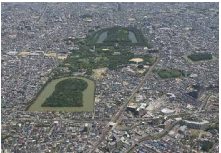
百舌鳥古墳群