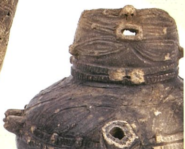
人面付注口土器 十腰内(2)遺跡