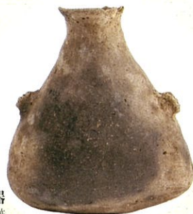
異形土器 埴渡遺跡