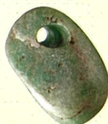
ヒスイ玉 ニツ森貝塚

青森市 細野遺跡・三内丸山遺跡・小牧野遺跡 外ヶ浜町 大平山元Ⅰ遺跡 鱒ヶ沢町 大曲遺跡 弘前市 十腰内(2)遺跡・大森勝山遺跡 つがる市 田小屋野貝塚・亀ヶ岡石器時代遺跡 東通村 下田代納屋遺跡 七戸町 ニツ森貝塚 東北町 長者久保遺跡 むつ市 角違(3)遺跡 三沢市 山中(2)貝塚 三戸町 松原(1)遺跡・杉沢遺跡 南部町 剣吉荒町遺跡・埴渡遺跡・荒屋敷遺跡 八戸市 荒谷遺跡・是川石器時代遺跡・長七谷地貝塚