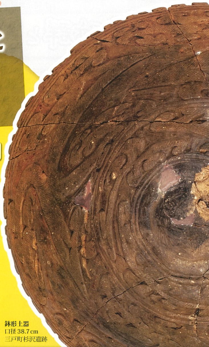
鉢形土器 口径 38.7 cm 三戸町杉沢遺跡