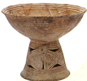
重文台付浅鉢形土器 宇鉄2遺跡