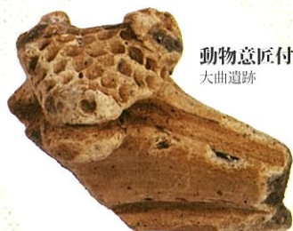
動物意匠付土器 大曲遺跡

本企画展は、今までの当館発掘調査の成果を一堂に展示・公開する初の展示会です。本展を通して、青森県の遺跡と縄文遺跡群への理解を深めていただければ幸いです。