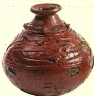
県重宝漆塗壺形土器 亀ヶ岡遺跡