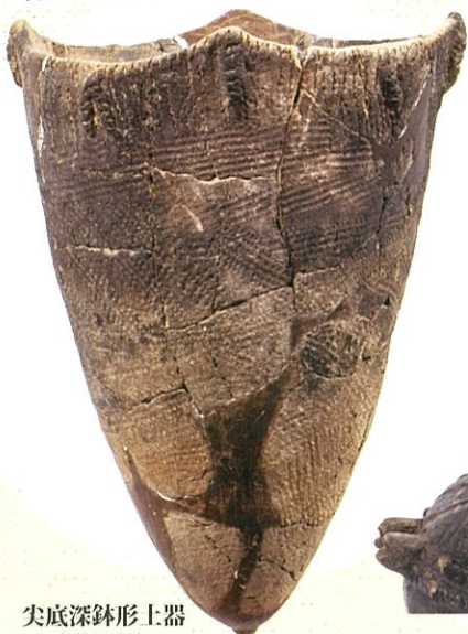
尖底深鉢形土器 下田代納屋遺跡