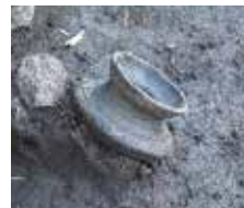
出土した注口土器

展示や遺跡への案内、世界遺産等に関する解説や案内は行っておりません。ご了承ください。