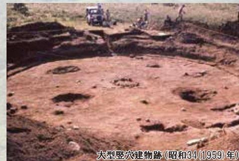
大型竪穴建物跡(昭和34(1959)年)