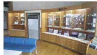
裾野地区体育文化交流センター 展示コーナー