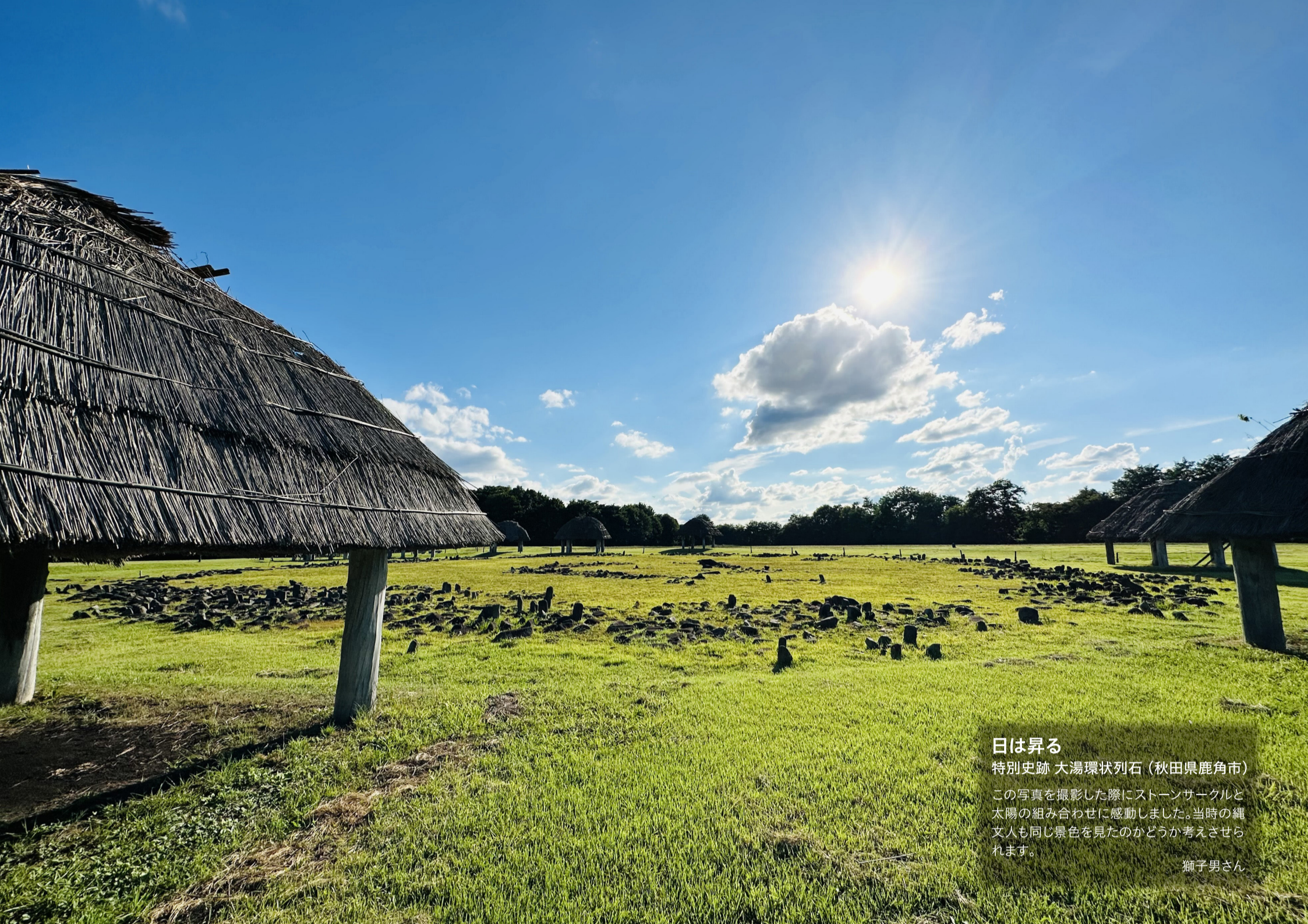
日は昇る 特別史跡 大湯環状列石（秋田県鹿角市） この写真を撮影した際にストーンサークルと太陽の組み合わせに感動しました。当時の縄文人も同じ景色を見たのはいかがでしょうか考えさせられます。