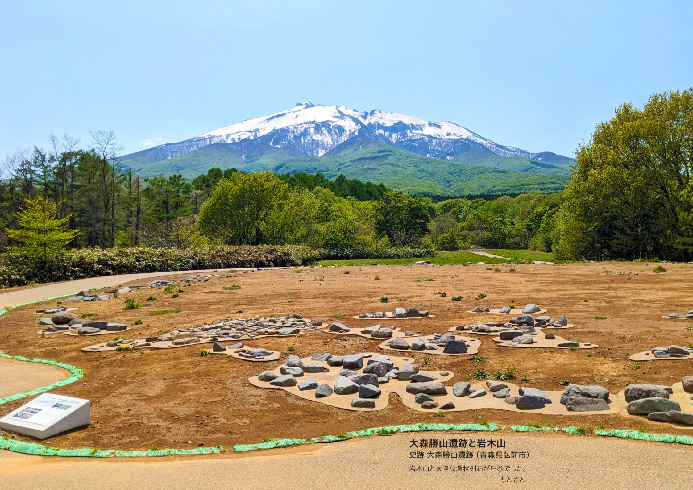
大森勝山遺跡と岩木山 史跡 大森勝山遺跡（青森県弘前市） 岩木山と大きな環状列石が圧巻でした。