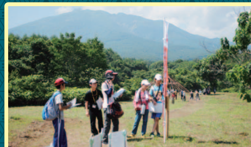
「おおもりかつやま縄文クイズラリー」