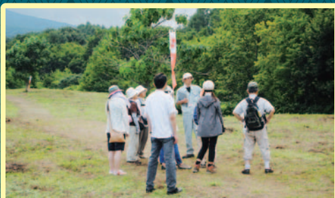
「おおもりかつやま遺跡探検隊」