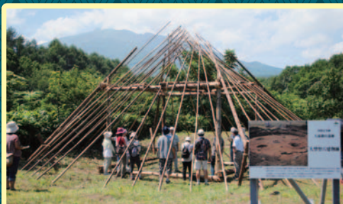
「たいけん! 竪穴建物」