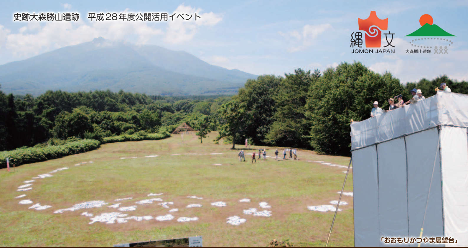
「おおもりかつやま展望台」