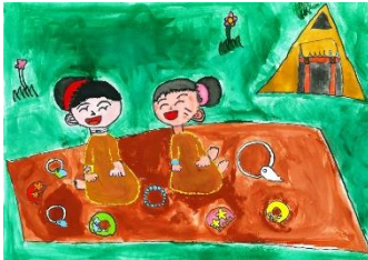
6 おかあさんと おしゃれ