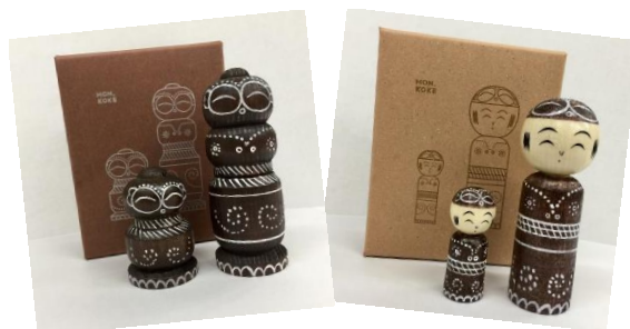
「もんこけ」どちらが届くかは楽しみに♪