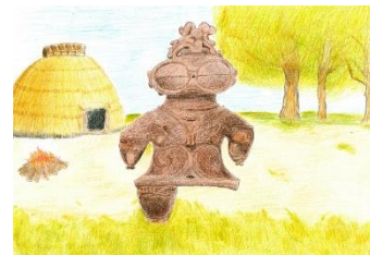
23 土偶と縄文の世界