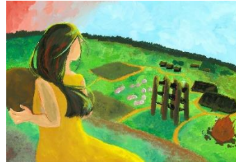
3 変わらない いつもの朝