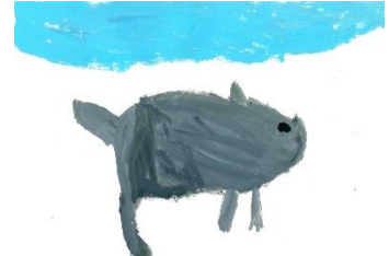
5 むかしの かわいい イノシシ