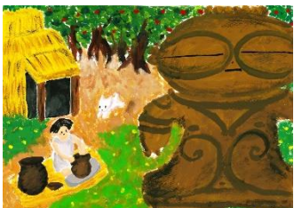
22 土偶が見た縄文の暮らし