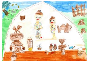
16 どごうさんにおねがい