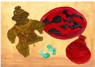
18 亀ヶ岡の美ケル・シャコ・ジャパン