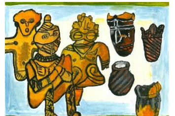
17 だいすき縄文時代!!