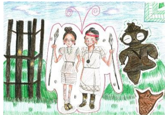
12 縄文の世界 古き良き時代