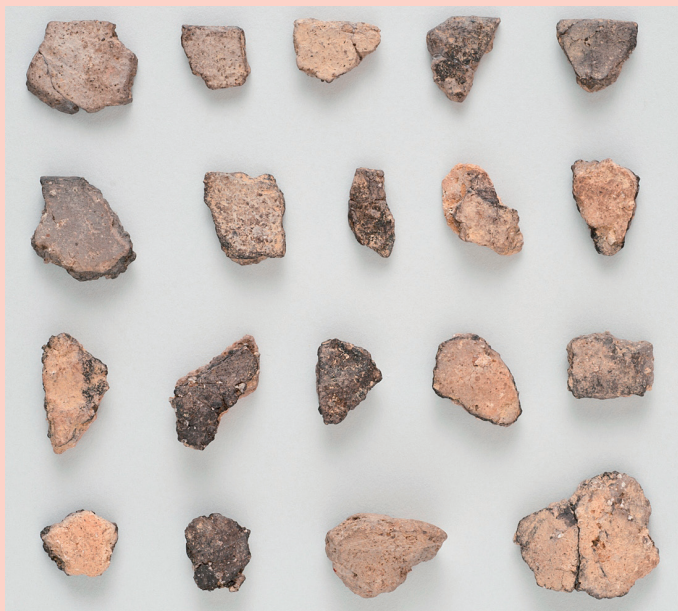
無文土器片 Plain potshards