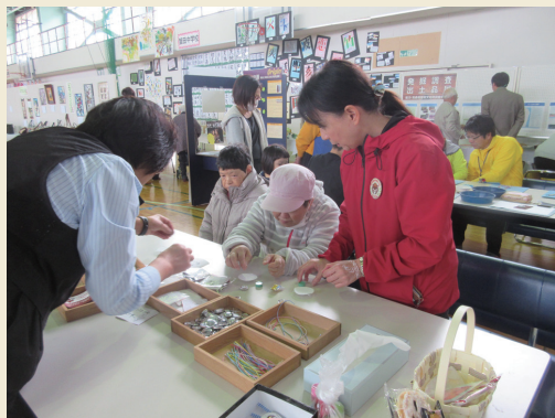
町民文化祭 Citizens' cultural festival