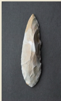
槍先形尖頭器 Spear point