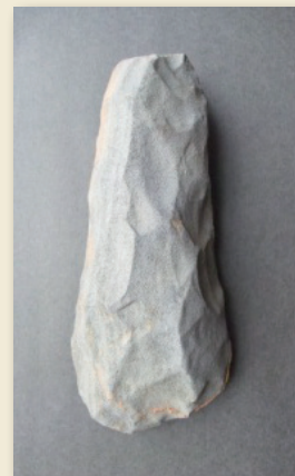
石斧 Stone axe