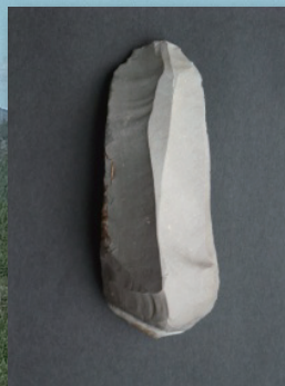
搔削器 / Scraper

While it is difficult to restore their original shape since the number of potshards is not large, it is possible to know that they had a round body with the flat bottom.