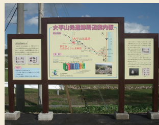
案内板 Interpretation signboards