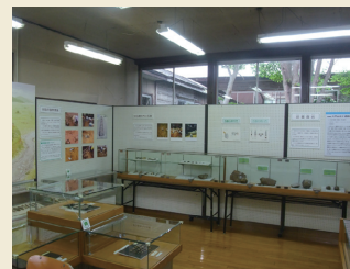
展示室3 Exhibition room 3