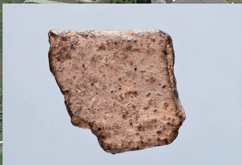
土器片 / Potshard

日本列島の縄文時代の始まり、土器の使用、石鏃の使用に関し及び旧石器時代の終焉についての歴史的課題にかかわる材料となり、その問題を解決する役割を果たすことのできる重要な遺跡です。