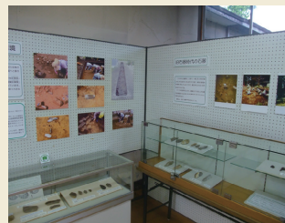
展示室2 Exhibition room 2