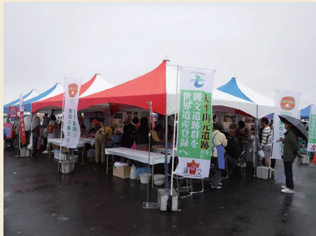
みなと祭り Minato Festival

When events such as Minato Festival and citizens' cultural festival are held in the town, a special booth is set up at the Odai Yamamoto Site to raise awareness of visitors about the value of the archaeological site.