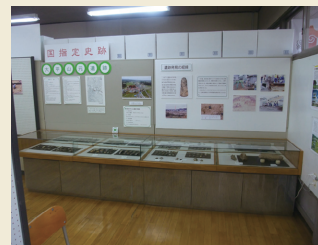
展示室1 Exhibition room 1