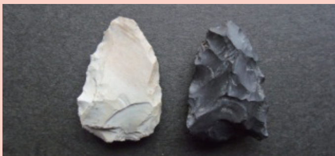
石 鏃 Stone arrowheads