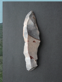
石刃 / Blade