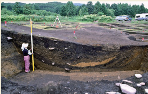
建物跡の断面 / Section of a pit dwelling site

また、ほかの地域に比べて建物が深く掘り込まれていることも特徴です。これは多くの人手を必要とする共同作業であり、安定して定住していた証しといえるでしょう。