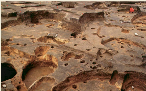
重複する建物跡 / Overlaid pit dwelling sites

特に建物内において、炉や儀式を行ったと考えられる施設の変化は顕著ながら連続性がみられることから、同一集団によって長期間にわたり集落が営まれた結果と考えられます。