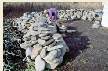
出土した大量の石皿 A great number of excavated stone plates

A great number of stone plates, which were probably used mainly for food processing, have been unearthed, evidencing that there were abundant food resources at the time.