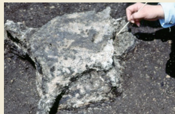
出土したクジラの椎骨 Excavated vertebra of a whale

The use of marine resources such as gigantic whales shows people's active engagement with the sea, which was an important source of food.