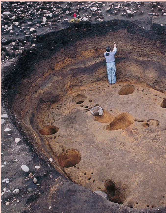
深さ 2.4m の大型建物 / Large pit dwelling site