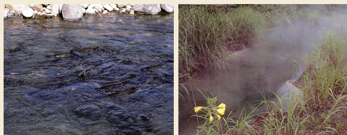
大舟川を遡上するサケ Salmon swimming upstream in the Ofune River

In autumn, salmon swim upstream in the Ofune River near the site. In the Jomon period, a lot of salmon should have swum upstream, too.