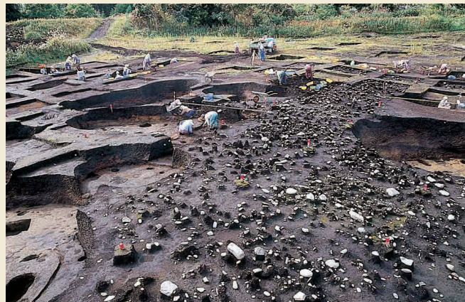
盛土遺構 / Remains of human-made earth mounds

発掘調査の結果見つかった多数の竪穴建物跡や貯蔵穴、お墓などの遺構は、当時の人々の暮らしぶりとともに、長期間にわたり集落が営まれたことを示しています。安定して生活できる恵まれた自然環境であったと同時に、多量の遺物が出土した大規模な盛土遺構の存在や、東北地方や北海道中央部からもたらされた土器や石器などの遺物からは、活発な交易が行われ地域の拠点集落として栄えたことが窺えます。