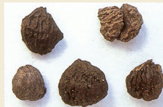
出土したクリ Excavated Japanese chestnuts

縄文時代前期に北海道に持ち込まれたクリは、その後自生し、食用はもちろん、建築材としてなど広く利用されていました。