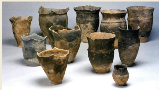
出土した中期後半の土器 Excavated earthen pots from the latter half of the Middle Jomon period

The pit dwellings at this site were found to be distinctively deeper than those found at other sites. Because it needed more people to dig deeper, this is considered to be evidence of the stability of people's life at this site.