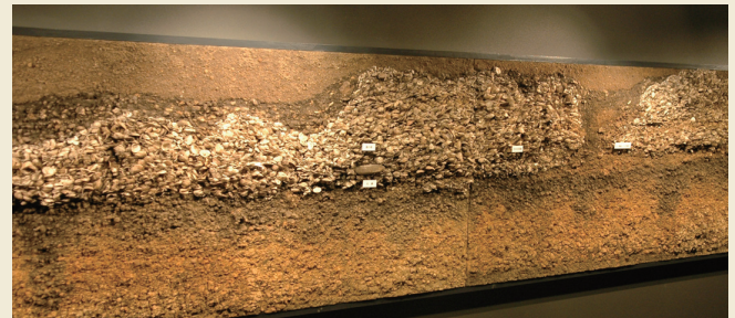
美々貝塚北遺跡の貝層断面の展示 Presentation of the shell layer cross section at the Bibi Kaizuka Kita site in Chitose City.

常設展示では、「千歳のおいたち」「こころの文化」などのコーナーで、旧石器時代から江戸時代にいたる千歳の歴史や文化を紹介しています。キウス周堤墓群の展示コーナーでは、1964・1965年の発掘調査について解説しています。