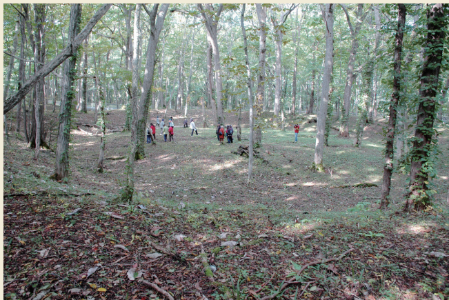
1号周堤墓近景 (2012年) Closeup view of Earthwork Burial Circle 1