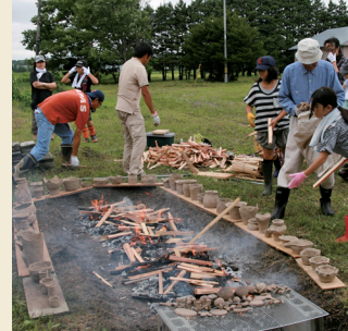
縄文土器づくり、野焼きで完成! Jomon pottery is fired in the open air.

Chitose City Buried Cultural Properties Center organizes various programs and events for visitors to learn about the Jomon culture by making magatama (comma-shaped beads), starting a fire, and cooking Jomon biscuits they way Jomon people probably did.