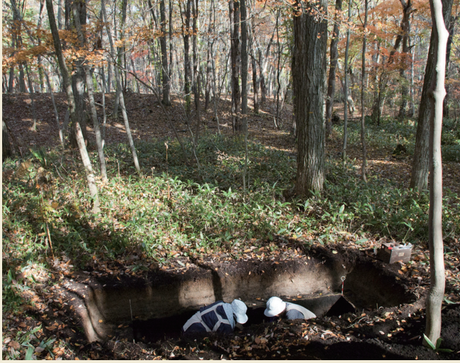
キウス2号周堤墓南側区域の調査 (2013年) Excavation of the southern part of the Kiusu Earthwork Burial Circle 2 (in 2013)