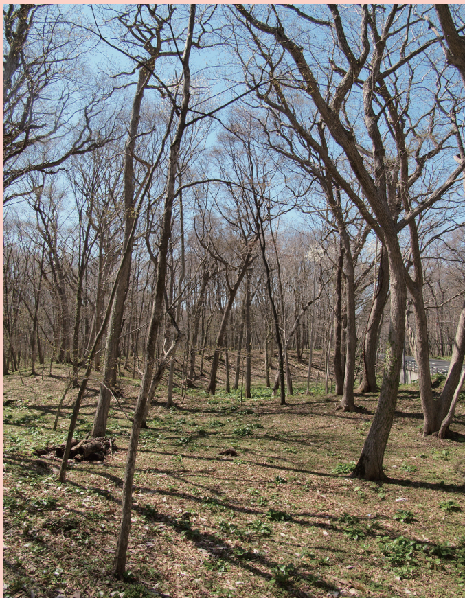
キウス2号周堤墓 / Kiusu Earthwork Burial Circle 2