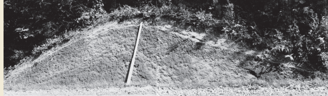
2号周堤墓周堤断面 (上: 2012年、下: 1965年6月) Section of Earthwork Burial Circle 2