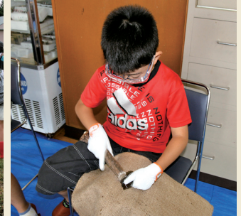
黒曜石は白滝産。 エゾシカの角を使って石器づくり! Let's make stone tools using horn of Hokkaido sika deer.