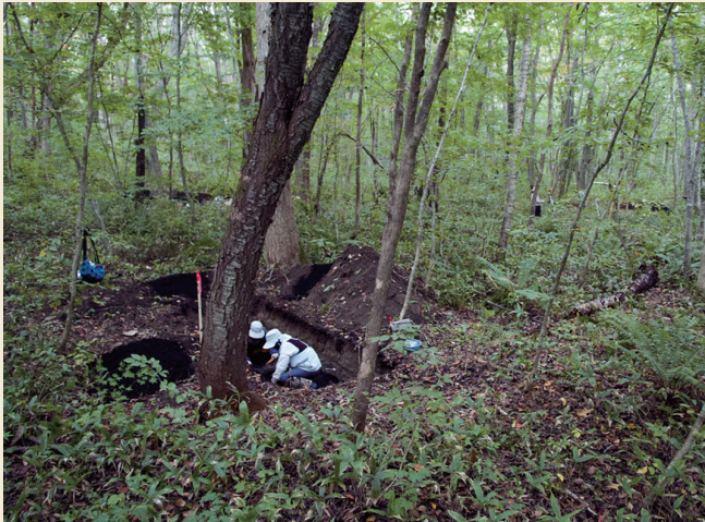
史跡周辺東側区域の調査 (2013年) Excavation of the eastern part of the site (in 2013)

2013～2017年の史跡周辺地区の分布調査では、小河川の北側で小型の周堤墓や周堤墓群と同時期の墓坑が新たに発見され、後期後葉の遺跡の広がりが確認されました。この成果を受けて、2019年に史跡の指定区域が拡大されました。