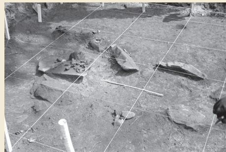
2号周堤墓墓坑検出状態 Grave pit of Earthwork Burial Circle 2