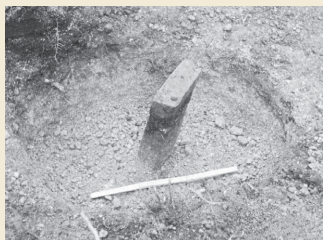
1号周堤墓第4号墓坑立石検出状態 Standing stone of grave pit 4 of Earthwork Burial Circle 1