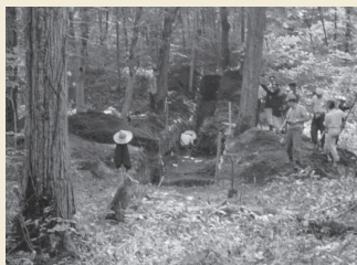
1号周堤墓の発掘調査区 Excavation area of Earthwork Burial Circle 1