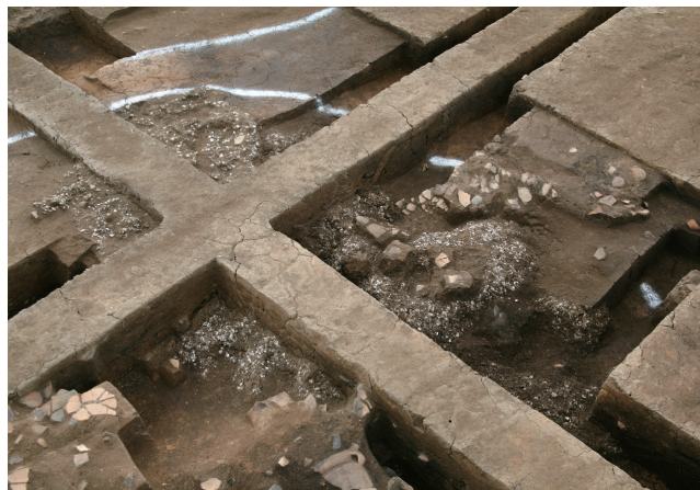
竪穴建物内貝塚と土器(縄文時代前期～中期)

Unearthed human bones of an adult female with a trace indicating she had given birth to a child (Early Jomon period)