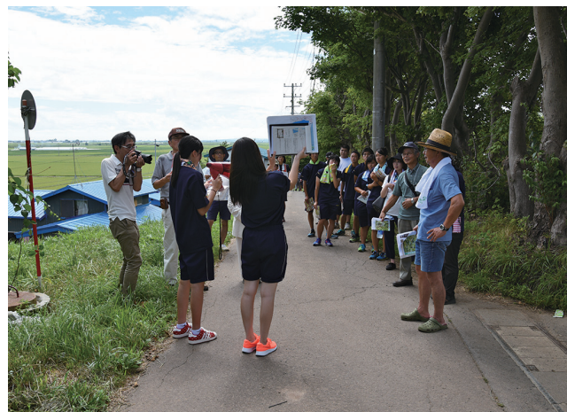
「田小屋野貝塚ウォーク」とガイドの地元高校生 Students of a local high school, Kizukuri senior high, explaining about the archaeological site at the walking event.

An NPO, Tsugaru Jomon-no-kai , and the Tsugaru City Board of Education jointly organize events related to Jomon culture in the summer season every year. Visitors are guided to walk around the archaeological site to learn about landscapes and places where shell mounds and human bones were discovered. Local high school students help as guides.