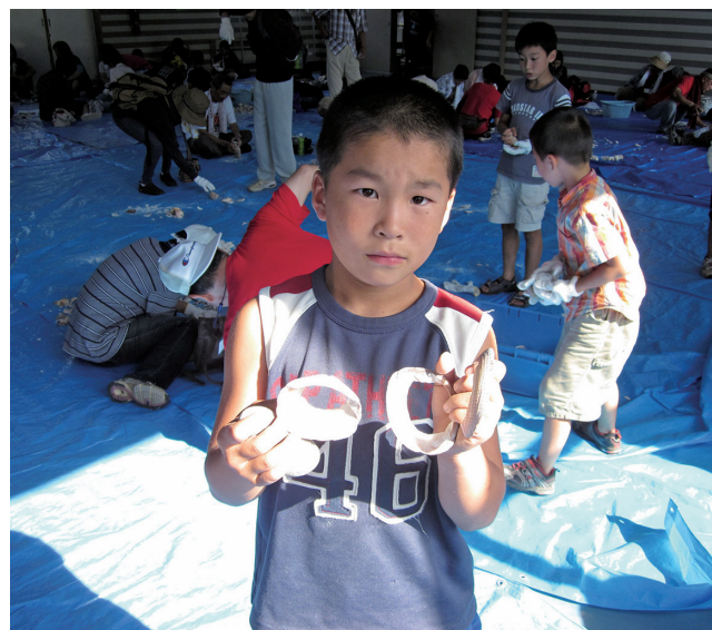
貝輪製作体験 Making bracelets out of the shells of Glycymeris albolineata

Events are organized for people to experience and learn how Jomon people made pottery or sea shell bracelets. Participants, not only children but also adults, enjoy working like Jomon people.