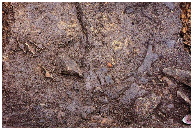
出土した海獣などの骨 (縄文時代前期)

Recent excavations reveal that shell mounds, pit dwellings and other remains of cylindrical pottery culture are distributed in a well-preserved condition.