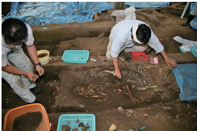
人骨調査状況 Human bones as excavated