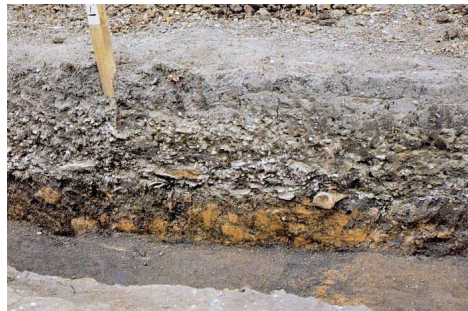
竪穴建物跡内覆土に 内包された貝層 (縄文時代前期)

Shell layer contained in the soil that covered a pit dwelling site (Early Jomon period)