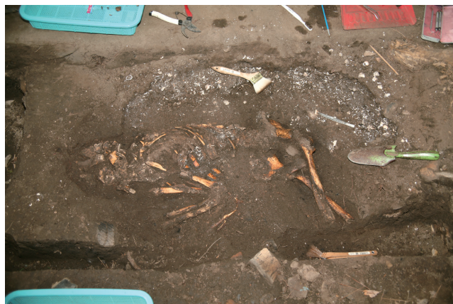
出産歴のある成人女性人骨(縄文時代前期)

Unearthed bones of marine mammals (Early Jomon period)