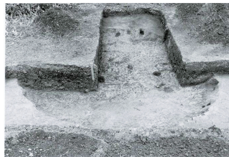
出土した竪穴建物跡(縄文時代前期) Remains of a pit dwelling (Early Jomon period)

Tagoyano Site is located on the southeastern tip of the tongue-shaped plateau with an elevation of 5-15 meters jutting out to the Tsugaru Plain. This site is represented by cylindrical pottery culture of 4,500-6,000 years ago which corresponds to Early to Middle Jomon period. The settlement was formed with a shell mound of the Early Jomon period on the Tsugaru Plain. The surrounding area had been submerged by the expanding brackish water of the ancient Jusan Lake in the so-called ' Jomon Transgression' of the seawater about 7,000 years ago. The shell mound is almost exclusively made of yamato-shijimi clams which were to be harvested from the brackish water. There are a few shell mounds to be found along the Sea of Japan, and due to the fact that this shell mound is located inland, this site is important to study the environment and subsistence of that period.