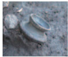
出土した注口土器