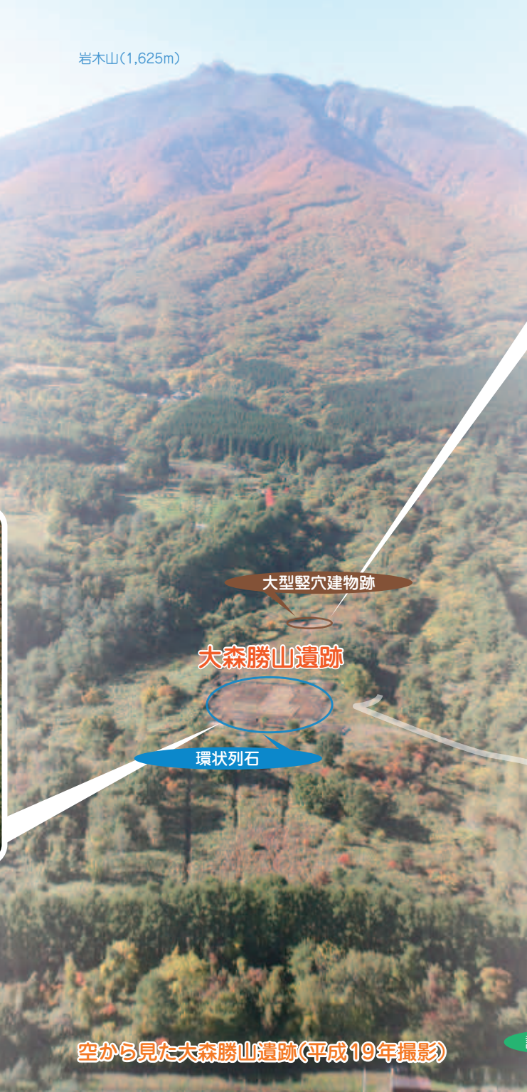
空から見た大森勝山遺跡(平成19年撮影)