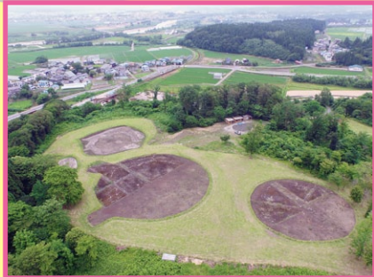
ストーンサークル