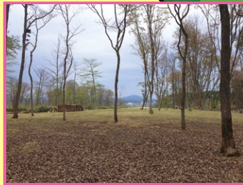
縄文の森 The Jomon Forest