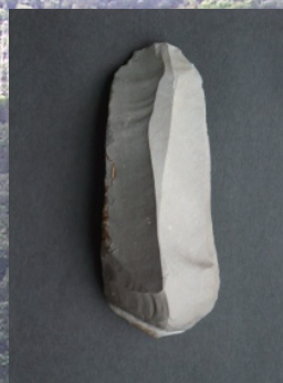
搔削器 / Scraper

While it is difficult to restore their original shape since the number of potshards is a few, we can reconstruct them to have the round shape with flat bottom.