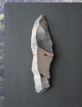
石 刃 / Blade