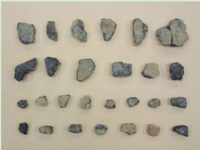
無文土器片 Plain Potshards