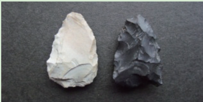
石 鏃 Stone Arrowhead