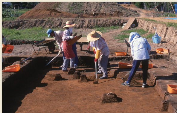
作業の様子 Excavation work

In 1975 and 1976, the Aomori Prefectural Museum excavated this site and revealed that the Mikoshiba-Chojakubo culture, which had been characterized by the stone tool assemblage(Spear point, Edge-ground axe and Blade etc.) and the absence of pottery, actually associated with plain pottery. This site is significant to open up a new horizon for the study of emergence of pottery and the beginning of Jomon period.