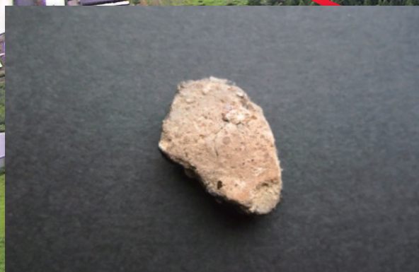
土器片 / Potshards

日本列島の縄文時代の始まり、土器の使用、石鏃の使用に関し及び旧石器時代の終焉についての歴史的課題にかかわる材料となり、その問題を解決する役割を果たすことのできる重要な遺跡です。