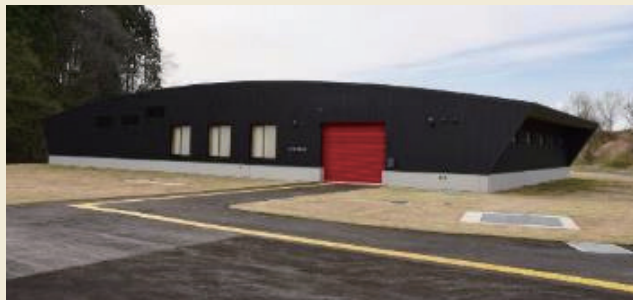
伊勢堂岱縄文館 / Isedotai Jomon Museum

There is a museum close to the archaeological site, where the results of archaeological excavations are explained and unearthed artifacts are on display. This facility is the base for preservation and utilization of the archaeological site.