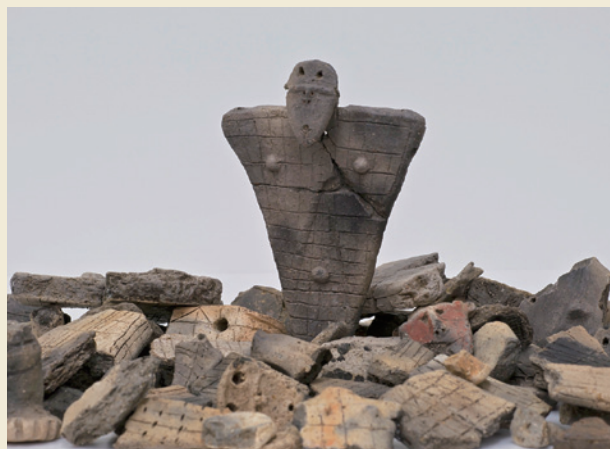
板状土偶 / Flat clay figurine

A complete clay tablet carrying a human figure has also been unearthed from a burial pit below Stone Circle B, while more than 200 incomplete clay figures have been unearthed from the Isedotai Site. Clay figures might have been intentionally broken in prayer.