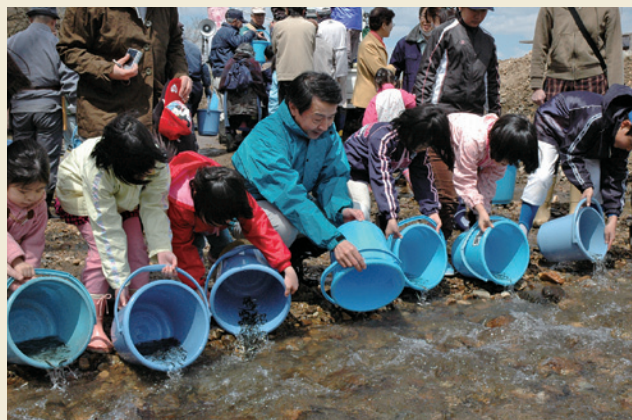
カムバック縄文サーモン / Releasing salmon fry into the river

The archaeological site is for people today to enjoy, as people in the Jomon period probably gathered around the stone circles for festivals or ceremonies.