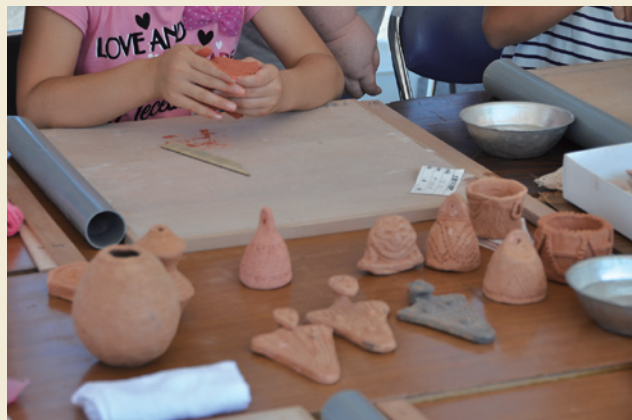
北秋田市縄文まつり / Making clay figurines (at Jomon festival)