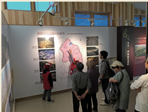
ジュニアボランティア / Junior volunteers

The volunteers' group, Isedotai Iseki Working Group , has been actively working since 1997 to help visitors as voluntary guides. They have also started the junior volunteer program to involve younger generations.