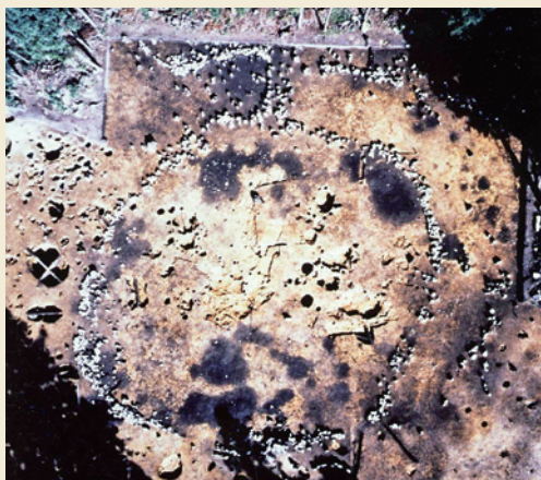
環状列石A / Stone Circle A

遺跡範囲は20万㎡に広がり、環状列石は遺跡北西部に集中します。遺跡の東部では100mを超える溝状遺構が発見されています。鉄器のない時代にこれだけの大規模な遺構をつくることは、多大な時間と労力がかかったのでしょう。