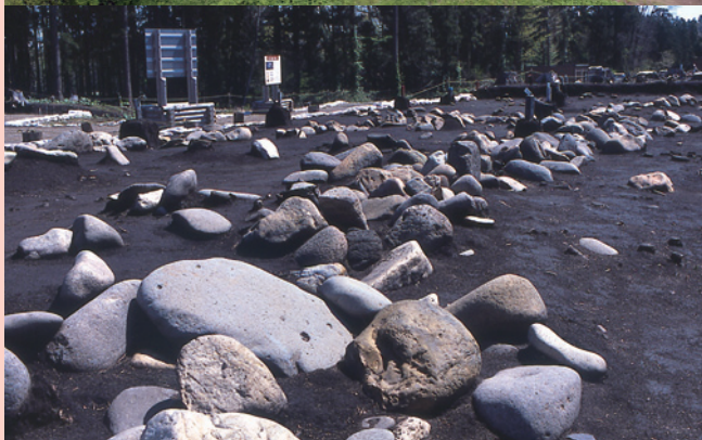
遺跡全景（上）と環状列石（下）／

Stone circles seen from the sky (top) and a closer look (bottom)