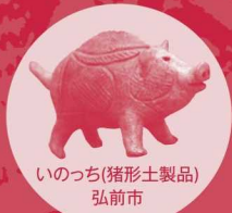
いのち(猪形土製品) 弘前市