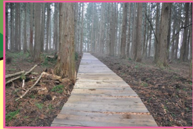
縄文の森 The Jomon Forest