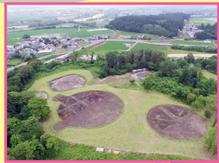
ストーンサークル