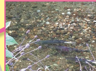
11月上旬にはサケが帰ってきます。