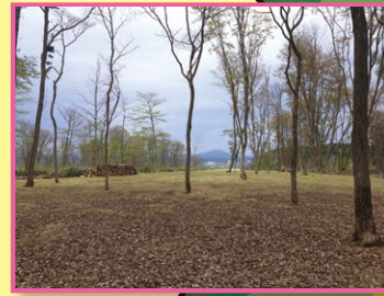
ストーンサークル Stone circles