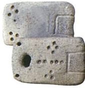
土版(大湯環状列石出土品)

〒018-5421 秋田県鹿角市十和田大湯字万座45番地 TEL. 0186-37-3822 FAX. 0186-30-4303 Mail. oyuscenter@city.kazuno.lg.jp