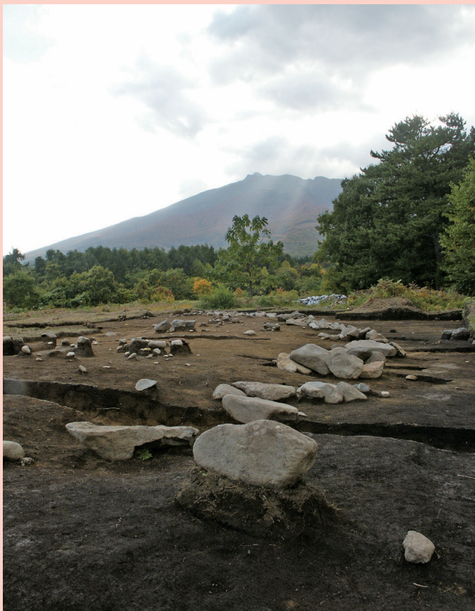
環状列石と岩木山 / Stone circle and Mt. Iwaki