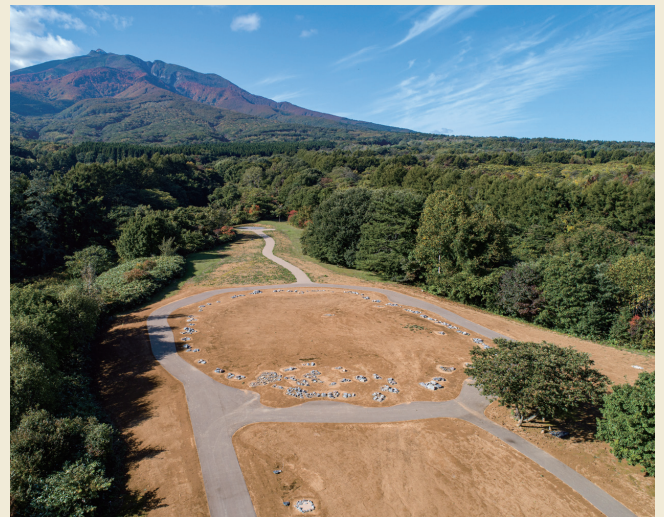
空から見た大森勝山遺跡と岩木山 Aerial view of Omori Katsuyama stone circle and Mt. Iwaki

Omori Katsuyama Stone Circle was discovered and excavated in 1959 in a rescue survey that was conducted for three years. A large scale pit dwelling about 13 meters in diameter, the biggest pit dwelling in Japan then, and a stone circle were discovered at this site. The land became public land in 1961 in order to protect the site. After a half century, it was re-excavated for three years from 2006. It made it clear when the stone circle was made and other remains were discovered around the stone circle, such as stonework hearth, buried pots, and dumping ground. Based on the research results, Omori Katsuyama Stone Circle was designated as historic site in September 2012.