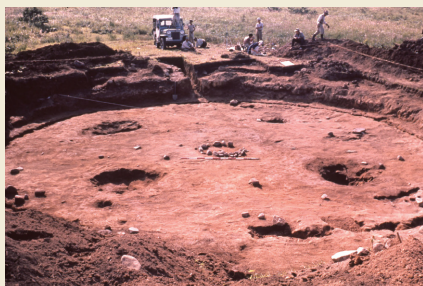
大型竪穴建物跡 (1959) Large scale pit dwelling

大型の竪穴建物跡は、環状列石の南西約100mに位置します。縄文時代晩期初め頃の遺構ですが、約3,000年を経ても埋まりきらず、調査当時は大きなくぼ地となっていました。直径約13mのほぼ円形で、中央に石組炉が見つっています。また、床面からは円盤状石製品が6個重なって出土しています。