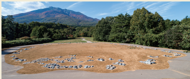
大森勝山遺跡から望む岩木山 / Mt. Iwaki from Omori Katsuyama Stone Circle

The Omori Katsuyama Stone Circle enjoys the view of the beautiful summit of Mt. Iwaki with almost no disturbing modern man-made structures. Such landscape probably unchanged from the Jomon period is one of the important values of this archaeological site.