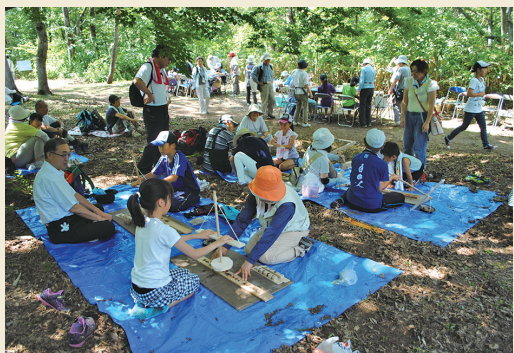
火起こし体験 Starting a fire with wooden tools