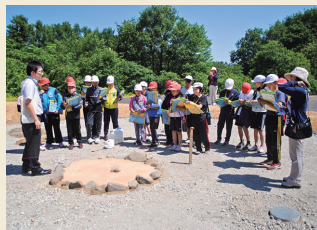
遺跡見学 Site inspection