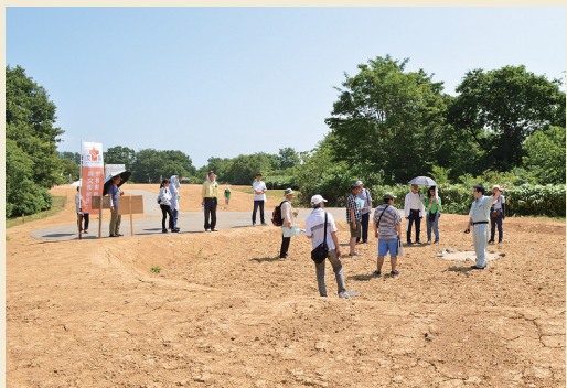
遺跡探検隊 Site expedition

Lots of events such as "Site expedition", "Jomon quiz rally", "Starting a fire with wooden tools" are held at the Omori Katsuyama Stone Circle in August.