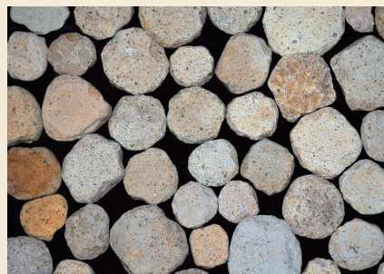
円盤状石製品 Disk-shaped stone object

大森勝山遺跡からは縄文時代晩期前半の土器、土製品、石器、石製品などが出土しています。土器や土製品には、亀ヶ岡文化特有の精巧な文様が見られるものもあります。出土品の中で特徴的なのは、組石の石材と同じ輝石安山岩を、直径5～10cmの円盤状に加工した円盤状石製品です。環状列石周辺から約250点出土しており、環状列石との強い関連性がうかがえます。