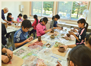
土器づくり体験 Let's make pottery!

For local primary school children, events are held such as making pottery, site inspection, and others.