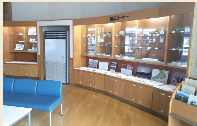
展示風景 Exhibit at the Susono District Physical Culture Exchange Center

This center introduces the history of the Susono area of Hirosaki City with artifacts unearthed from the Omori Katsuyama Stone Circle and exhibit panels.