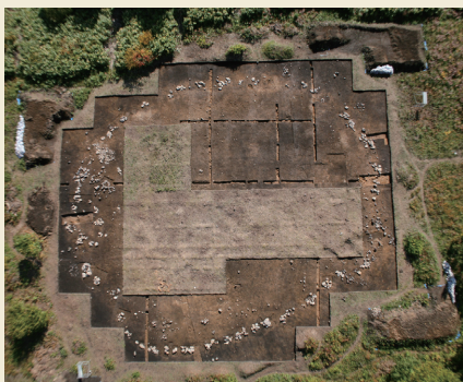
真上から見た環状列石 (2007) Stone circle viewed from directly above

環状列石は、整地した台地の上に円丘状に土を盛り上げ、その盛土からやや下った縁辺に、長径48.5m、短径39.1mの楕円形に組石を配置して作られています。77基ある組石には、総数約1,200個の石材が使われており、その多くは遺跡の南北を流れる川から運ばれた輝石安山岩です。