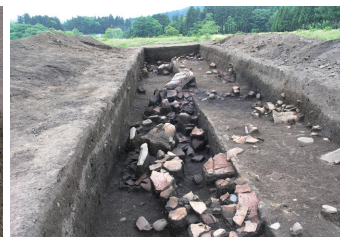
埋設土器・捨て場 / Burial jar / Dump