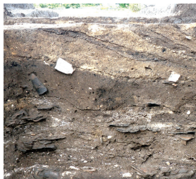
貝塚 Shell mound