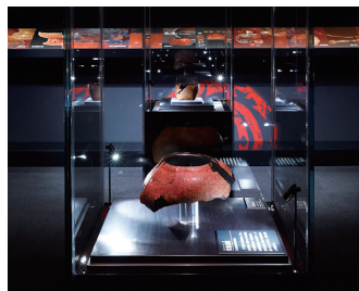
漆の美展示室 Jomon lacquerware on display

The Korekawa Archaeological Institution near the Korekawa site exhibits the unearthed artifacts that show the craftsmanship of the Final Jomon period. It also organizes seasonal special exhibitions introducing the attractive findings of the Jomon culture in the Tohoku region and elsewhere throughout Japan.