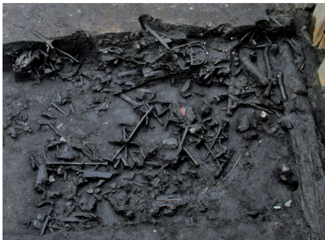
低湿地捨て場 Remains of a dumping ground excavated in the low wetland

At the Korekawa site, archaeological excavations are underway to find substance of this Jomon settlement. So far, archaeological remains of dwellings, graves, dumping grounds, and shell mound have been found. The alkaline environment of the shell mound and dumping grounds preserves the remains of animals and plants in good condition, providing an important information about how people used animals and plants in the Jomon period. Joint researches are also carried out with external research institutes to draw new information from this archaeological site.