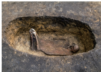
土坑墓 Pit burial