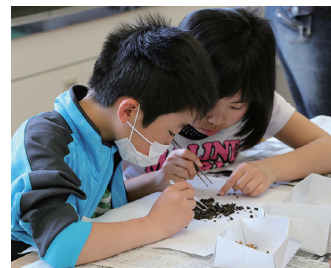
企画展イベント Special exhibition event