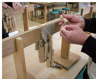
縄文の布を編む Making a Jomon cloth

Various programs are provided at the Korekawa Archaeological Institution for visitors to experience how people made different things in the Jomon period. Participants in these programs can learn the craftsmanship of the Jomon people in detail.