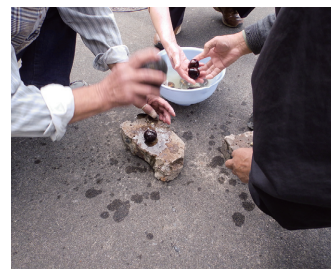
トチの実で縄文クッキング Cooking horse chesnuts